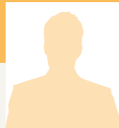
Marius DELCAMBRE Conseil en séjour