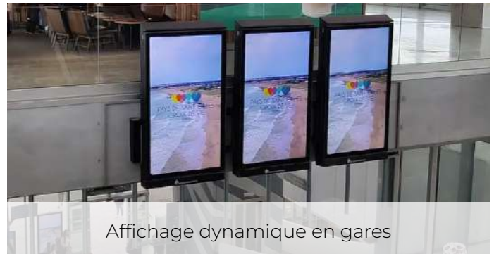
Affichage dynamique en gares

Diffusée de mi-mars à fin mai 2024, à destination des clientèles des Pays de la Loire, Bretagne, Normandie, Ile de France, Deux-Sèvres, Charente Maritime et Gironde. Bannières sur Facebook, Instagram et Google Ads : 13 500 clics sur la page d'atterrissage dédiée. Plus de 625 000 personnes touchées.