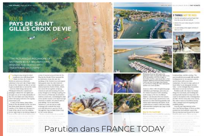
Parution dans FRANCE TODAY