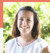
Pauline ROUSSEAU Éditions Promotion Infographie