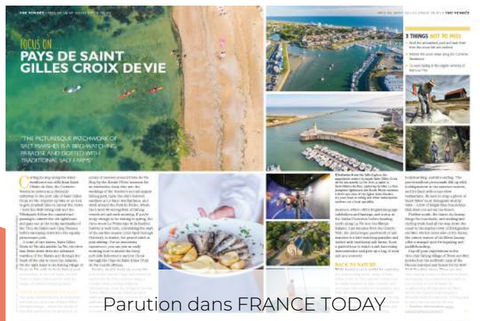
Parution dans FRANCE TODAY