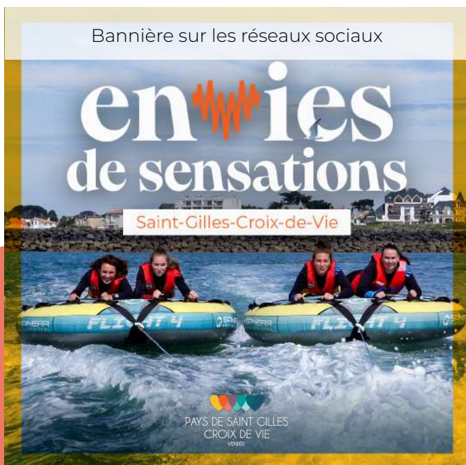
Bannière sur les réseaux sociaux