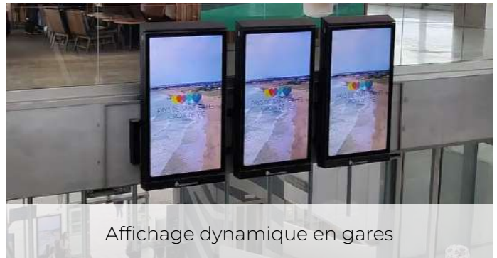
Affichage dynamique en gares

Diffusée de mi-mars à fin mai 2024, à destination des clientèles des Pays de la Loire, Bretagne, Normandie, Ile de France, Deux-Sèvres, Charente Maritime et Gironde. Bannières sur Facebook, Instagram et Google Ads : 13 500 clics sur la page d'atterrissage dédiée. Plus de 625 000 personnes touchées.